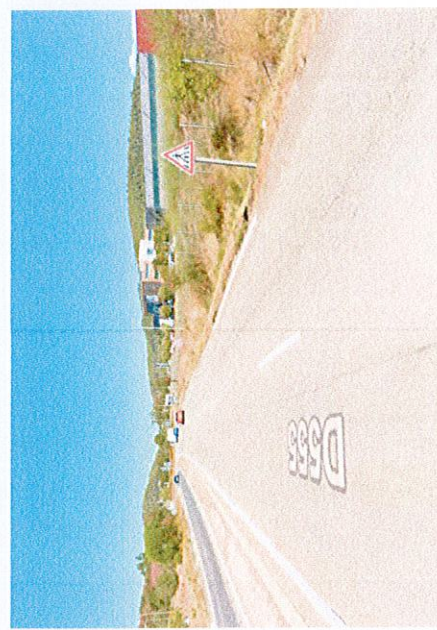
D555 sens DN7 - Giratoire des Bréguières